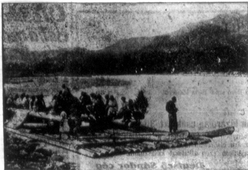
Társas tutej-utazás az Isar folyón.