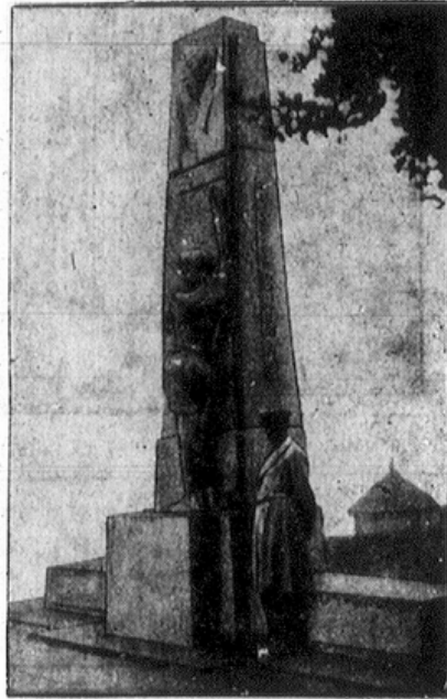
Briand-émlék Bratagne-ban, Treburden-ben, ahol Briand nyaralni szokott.

Az Országos Pomológiai Bizottság összeállította és ajánlja ültetésre azon gyümölcsfákat, melyek vidékenként a legjobb eredménnyel termeszthetők. Nagykanizsa környékére ajánlott fajok legelőnyösebben szereszthetők be.