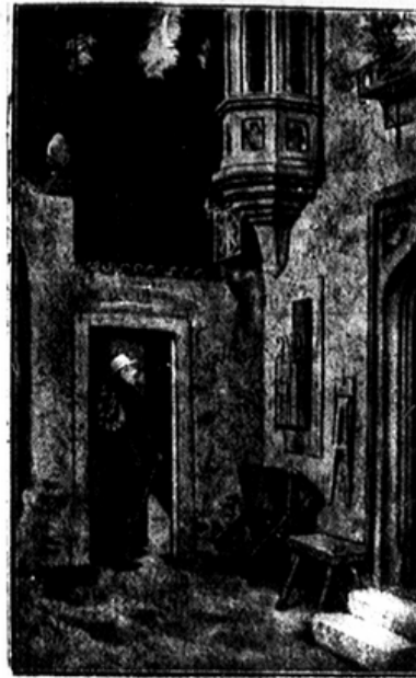
Idilli 100 év előtt.

„Bucsu“ (Moritz v. Schwurd festménye, 1804—1871)